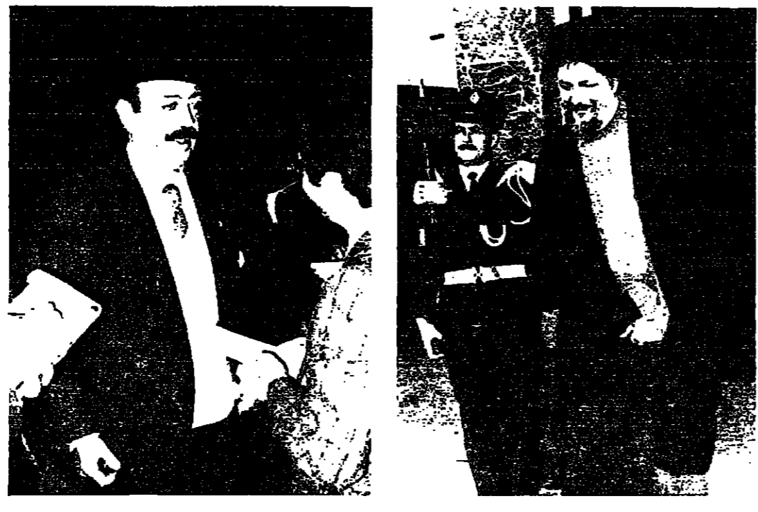
الامام الصدر بخاردا القصر .. والامام الصدر بخاردا القصر